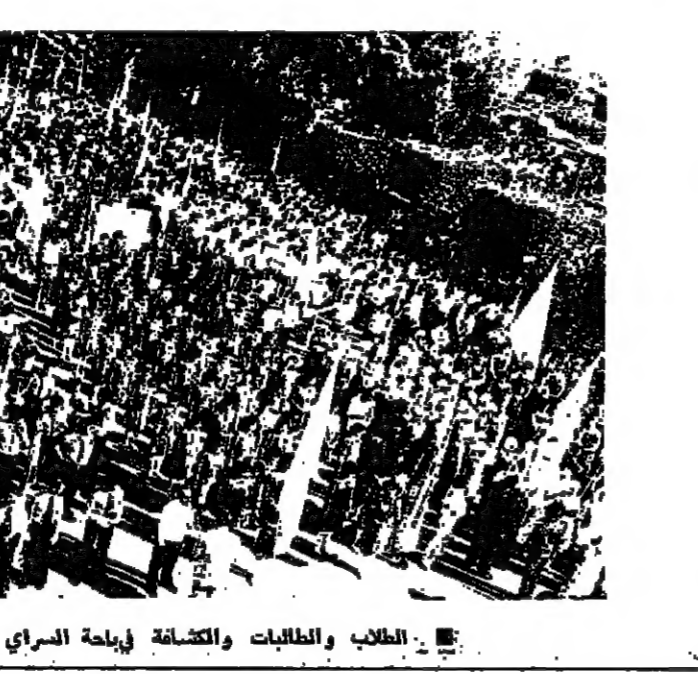
الطلاب والطالبات والتكشافة في احياء السراي في طرابلس

الاجتماعي والذي اشتركت فيه جميع الهيئات والجمعيات والتكشافة وطالبات وطلاب المدارس الرسمية والخاصة الى مهرجان بهذه المناسبة.